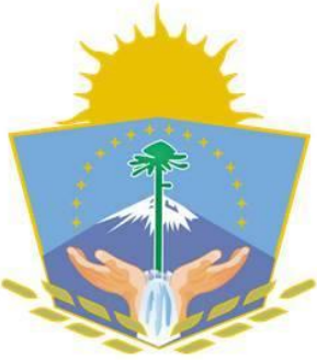
Escudo de Neuquén