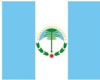
Bandera de Neuquén