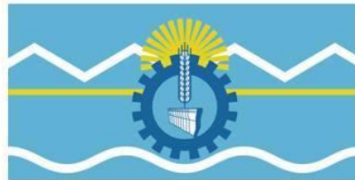
Bandera de Chubut