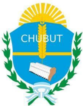
Escudo de Chubut