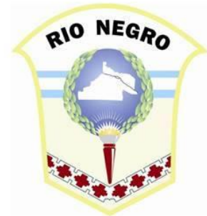
Escudo de Río Negro