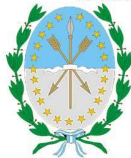
Escudo de Santa Fe