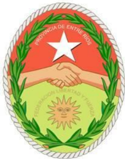
Escudo de Entre Ríos