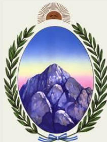
Escudo de La Rioja