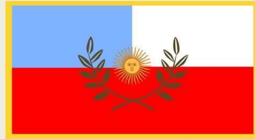
Bandera de Catamarca