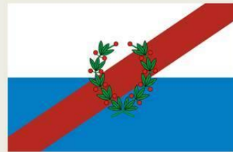
Bandera de La Rioja