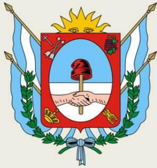
Escudo de Catamarca