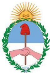
Bandera de Jujuy