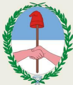
Escudo de Tucumán