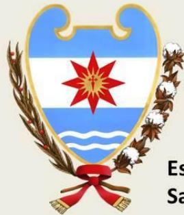
Escudo de Santiago del Estero