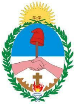
Escudo de Corrientes