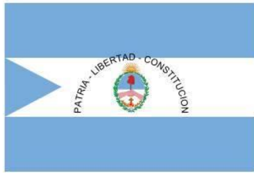
Bandera de Corrientes