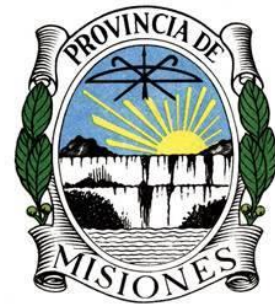
Escudo de Misiones