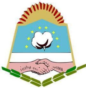
Escudo de Formosa