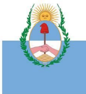
Bandera de Mendoza