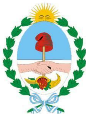
Escudo de Mendoza

La bandera es un paño blanco con el Escudo Provincial en su centro.