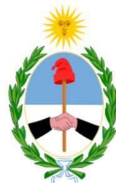
Escudo de San Juan